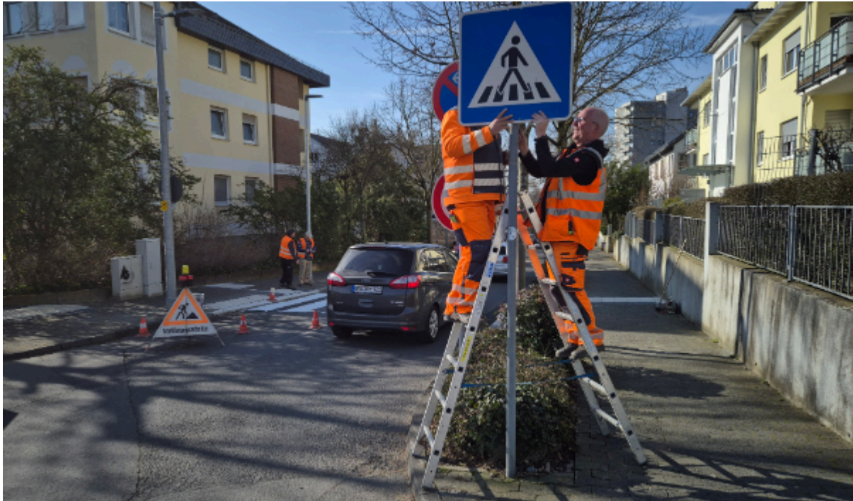
Städtische Mitarbeiter montieren ein Verkehrszeichen.

Ein guter Vorschlag aus dem Bad Sodener Kinderparlament wurde in diesen Tagen umgesetzt: Ein Zebrastreifen als Fußgängerüberweg über die stark befahrene Kronberger Straße soll dazu beitragen, dass nicht nur Schülerinnen und Schüler die Straße leichter überqueren können.