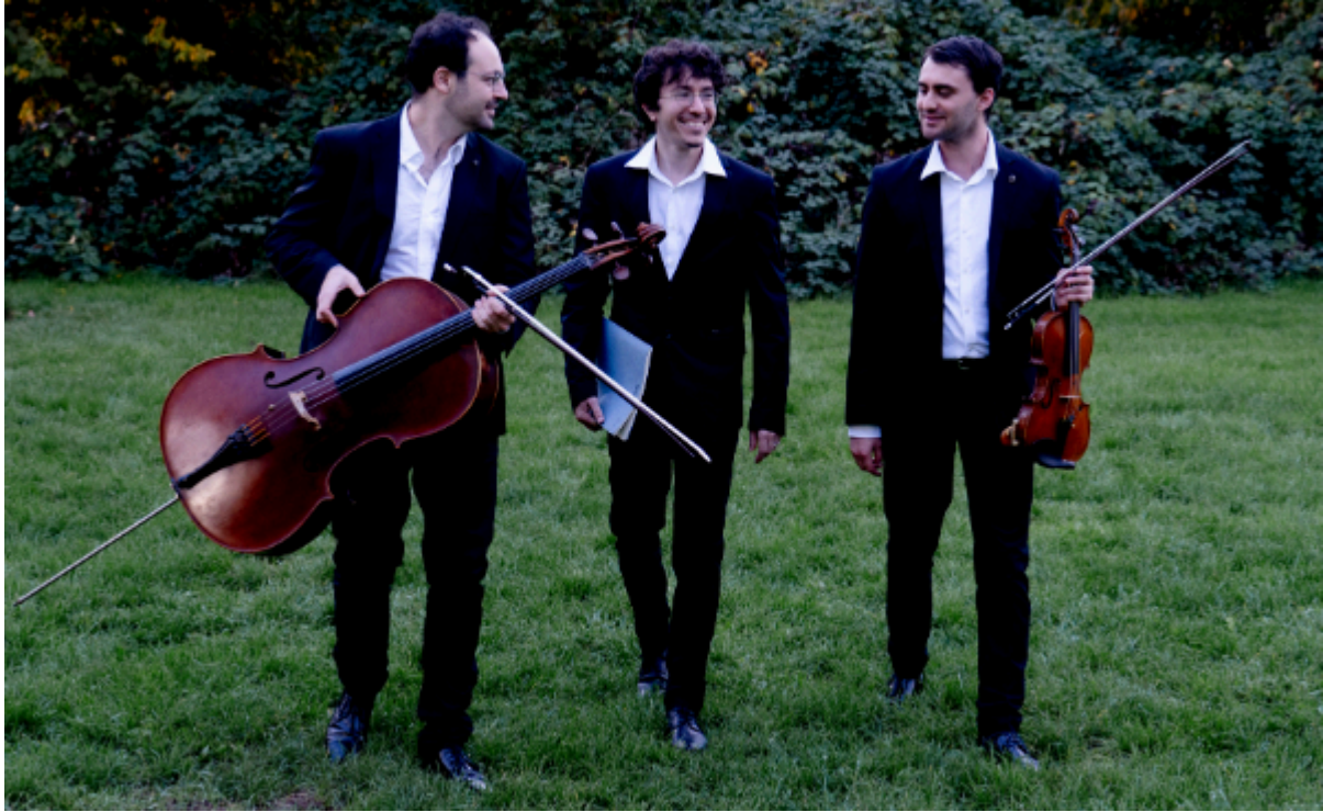
Das Trio Delyria ist zu Gast im Landratsamt in Hofheim.

Bei einem Benefizkonzert treten am Sonntag, 10. November 2024, um 17:00 Uhr drei in Deutschland lebende israelische Musiker Delyria im Landratsamt auf. Das Trio Delyria wird dabei von einer Tanzperformance unterstützt. Der Erlös des Konzerts kommt der Main-Taunus-Stiftung und einem regionalen Deutschprojekt zugute. Kooperationspartner sind die Rotarier.